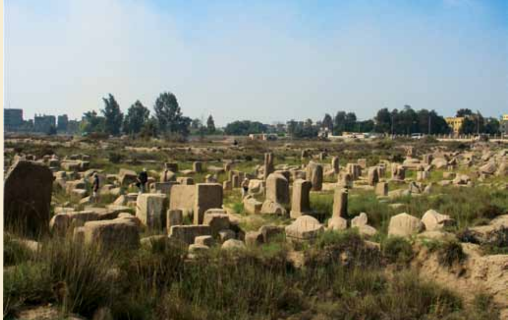
Ruinerne af Bubastis.

Et fransk hold, ledet af P. Brissaud, som har arbejdet igennem flere år i Tanis, har fundet 120 kalkstensblokke, sandsynligvis oprindeligt fremstillet ved tempelbyggeri under kong Orsokon II (22. dynasti), og genbrugt af senere herskere. Blokkene har formentlig været genbrugt til at bygge en afgrænsningsmur, som omgav en hellig sø ved et Mut-tempel. Søen var 30 x 12 m i om-