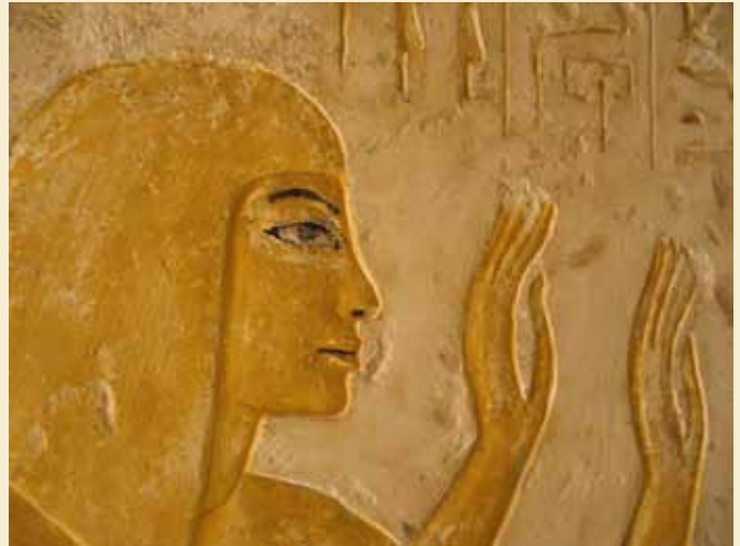
Fra Mayas gravkammer.

båden, før den kan udstilles. Båden ligger delt i mindre stykker, tæt pakket i hullet og er angiveligt mindre end den allerede kendte solbåd. Over stedet har man rejst et solidt markisetelt. Projektet stod stille som følge af januarrevolutionen, men som billedet viser, var døren åben i oktober, hvilket tyder på, at aktiviteterne er blevet genoptaget. http://news.nationalgeographic.com/news/2011/06/pictures/110624-egypt-wooden-solar-boat-sun-discovered-pyramids-science-archaeology . Her findes også billeder fra fundet. Lagt på hjemmesiden juni 2011. http://www.drhawass.com/blog/second-solar-boat-giza . Lagt på hjemmesiden juni 2011. 'Nile Currents', Kmt 22/3, 2011, s.5.