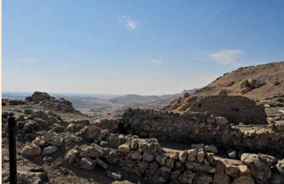
Ruinerne af Deir el-Bakhit.