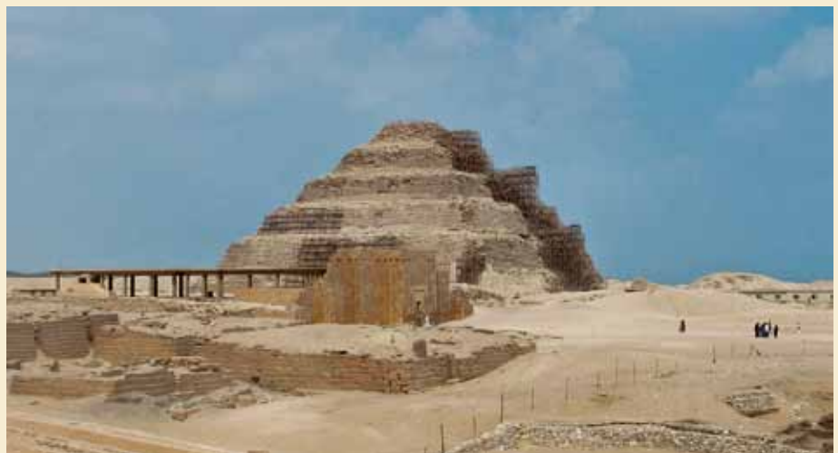
Trinpyramidens imponerende stillads. Foto LM okt. 2011.

I det forgangne år har der været flere rygter i den elektroniske presse om den vidtgående restaurering af trinpyramiden, der påbegyndtes i dens sydøstlige