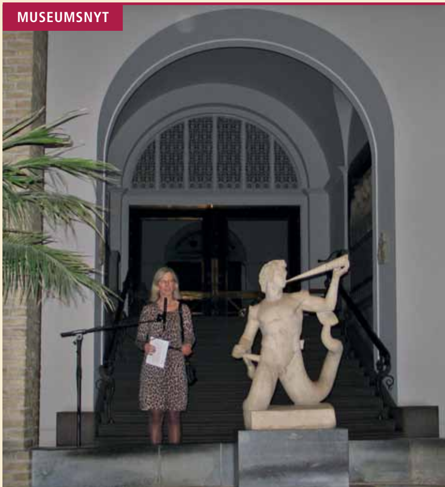
Fra åbningen af udstillingen på Glyptoteket.