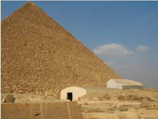
Teltet over den nye båd. Foto LM okt. 2011.