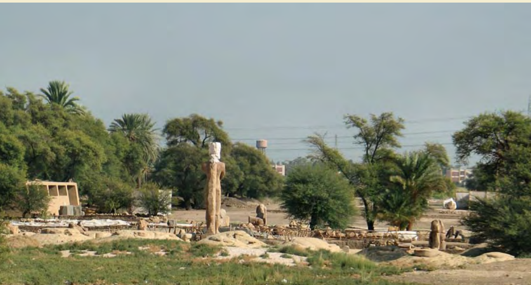
Udgravningsområdet fotograferet november 2008.