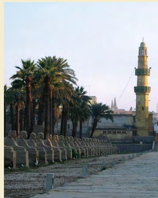
En moske ligger i vejen for rydningen af sfinx-alléen.