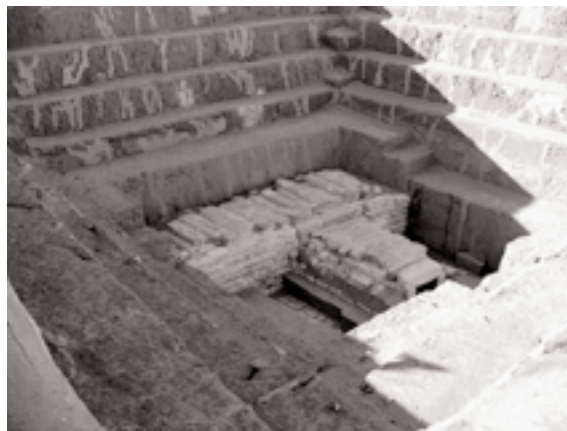
Til venstre: Den ufuldendte obelisk.