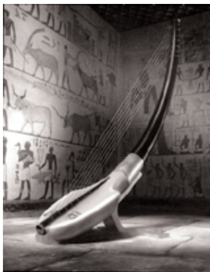
Computer-konstrueret harpe fra bogens forside.

Det er forfriskende at få en helt ny person til at blande sig i den musikvidenskabelige debat, og især en forsker, der har specialiseret sig i studiet af tidlig musik. Når jeg selv skriver om musik, er det jo fra en ægyptologs synspunkt (med en vis erfaring i fremstilling af blæseinstrumenter). Man kan ikke forvente at finde en, der er specialist i begge dele. Det er gennem dialog og samarbejde mellem de to discipliner, at